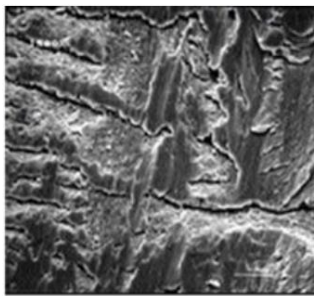
After Leading Synthetic*